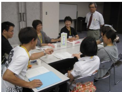
グループワークを通じ、職種を超えて意見交換をされていました