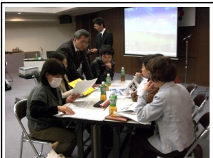
現状と課題を話し合っています