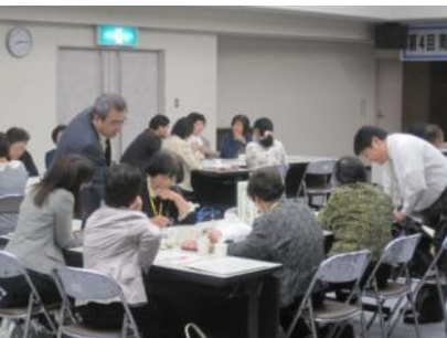
徐々に熱が入り活発に意見交換をされていました