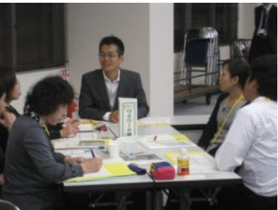
講師の先生からも積極的にアドバイスをいただきました

福祉や医療など多職種の方でグループを構成し、互いの立場で直面する問題点や、課題解決の取り組みについて前向きな意見が交わされました。そして自分のなりたいた姿や実践したい事を四画面思考『成功の宣言』として掲げました。