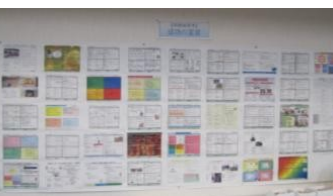
受講者が作成した四面思考『成功の宣言』です

成功の宣言 将来 子供達が住みたいと思う地域にしたい 砺波医療圏の在宅を支えるネットワークを作る 訪問看護を通じて地域の皆様の健康や介護予防にも役立つ 在宅において必要な方に適切なリハビリテーションを提供する みんなで子どもの健康を考え、支えあえる家庭(地域) 『笑う門には福来る』 身近で自分が出来る事から見つけたい 在宅支援活動を行う すべての南砺市民が安心して医療、介護が受けられる社会にする! 医療センターの利用者の増加 他の地域に自慢できるようなリハビリネットワークを作り出す 在宅での心リハ体制の確立 高齢になっても認知症になっても地域で暮らせる 笑いで免疫アップ! 医療費が減った南砺市 地域社会と連携し健康な生活を作る 介助者が負担にならない介護を思いやる支援に繋がる 地域の方で人生に寄り添う医療を 私の老後・病と仲良く付き合いたい 食べながらお話を待てる地域 健康づくりに関心が高まる地域づくり 介護が必要になっても笑顔で暮らせる地域作り みんなで介護予防 「健康教室」を継続し、共に学んで、健康寿命を延ばそう 死ぬまで自分の家で過ごす。 南砺市の床ずれ撲滅作戦、「無駄な手間、医療費削減」 地域に密着した頼りにされる診療所 ほっと あつと 健やか なんと! 医療福祉職の魅力を伝える伝道師になろう! 最期の死に方・生き方を自分で選べる地域(五箇山)へ 笑顔を持って地域住民と共に生きる 在宅療養者とその家族の皆さんが不安なく過ごせる社会 地域住民が安心して利用できるリハビリをつくる その人らしい生き方を尊重し、人と人が出会うつながりが大切にされる地域にする あふれる笑顔、しあわせなくらし ここで「住み続けたい」という想いが実現できるまちづくり 将来、終末を自宅で迎えるために 元氣な地域づくり 「よいとこ」発掘で愛される公立南砺中央病院に! なんと地域に、無理をしない介護を発信する 言葉「南砺の実践を守り、地域と共に生きる」 「お元氣さま」みんなで作る元氣発信地域! 南砺市民の安心・安全の支えとなる