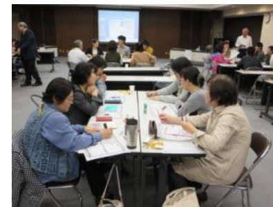
グループワークを通じ、人材のネットワークづくり

会話から 地域のつながり 強めよう 職員一人ひとりが活躍できるパワー全開社協 人を守る 南砺の元気を、まず自分から！！ 笑顔ある 気付毎日 共に生き はしる喜び 健康也 人の輪・地域の輪づくり 訪問リハビリを知ってもらい、地域で活躍する！！ やりがい、生きがい、生活の質の向上を目指す 患者に頼られる臨床検査技師！！ 患者・家族のよりどころはリハビリテーション室！ 幸せをつかむ ほ～！問看護ステーションになる 男が女性を介護 仕事が楽しい！と思える職場づくり みんなで楽しく農作業でつながる地域づくり ロコモマイスターの育成を！ 自他ともに ありのままを受け入れ 生きる 鳥の目を持ったMSMになる 南砺市だから大丈夫！ 在宅緩和ケア 「食べる楽しみ」で健康長寿に一役かいます おもたのしいは地域の元気処方箋 一人暮らしの住民が死を迎えるに地域住民で出来ること 健康は笑顔あふれる第一歩 大好きな 城端に住み 笑顔あり 富山型だよ バリアフリー 自分が変われば、周りも変わる！今日から笑顔でプラス思考！ にっこり 笑顔が見えれば、連鎖して わたしも嬉しい あなたも嬉しい ペピーカーからシルバークーまで共に支えるなんとシティー 今、私が輝くと！ 地域交流の盛んな開かれた施設作り 幸老人マイスターになる ときどき ランチ(五箇山では) 地域で一番の苗科にする！！ 心身ともに健康な地域づくり 笑顔で安心してその人らしく療養生活が送れる 健康美で素敵な笑顔になる 一年目、笑顔と元気で 突っ走り 患者様と医療職員が過ごしやすい病院