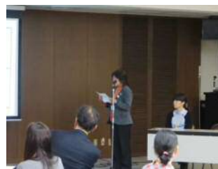
受講者が各自の『成功の宣言』を発表