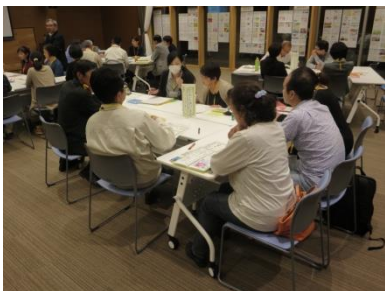
グループワークを通じ、課題解決の糸口も見えてきます

多職種・同地域の方でグループを構成し、地域で直面する問題点や、課題解決の取り組みについて意見が交わされました。そして自分のなりたい姿や実践したい事を四画面思考『成功の宣言』として掲げました。