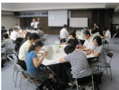
最初は緊張した面持ちだった受講生でしたが