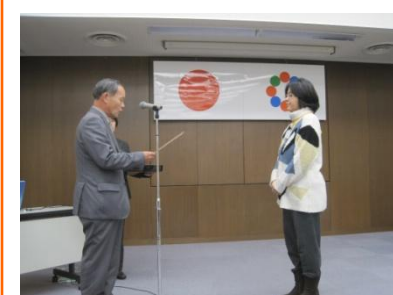
中山地域包括医療・ケア局管理者から、修了生のみなさんへ修了証書の授与とお祝いのメッセージが贈られました。

この講座を卒業した第4期生は、これまでの修了生が活動する「南砺の地域医療を守り育てる会」に参加することとなり、講義で培ったネットワークを生かし地域の再生について仲間と考え、継続して自ら行動していかれる事が期待されます。