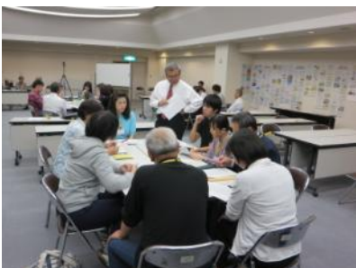
講師の先生からも積極的にアドバイスをいただきました