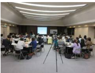
最初は不安と緊張の面持ちだった受講生の皆さんも