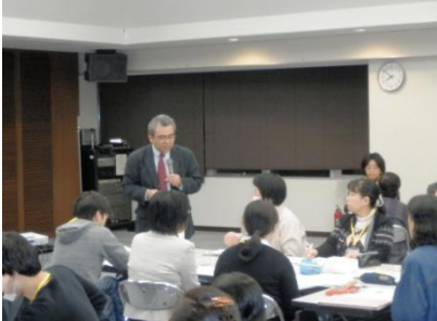
講師の先生からも積極的にアドバイスをいただきました

福祉や医療など多職種の方でグループを構成し、互いの立場で直面する問題点や、課題解決の取り組みについて前向きな意見が交わされました。そして自分のなりたてたい姿や実践したい事を四画面思考『成功の宣言』として掲げました。