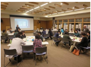
グループワークを通じ、多職種の連携が図られます