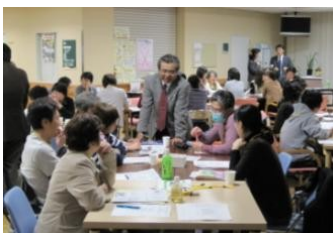
和やかな雰囲気のもと前向きな意見が飛び交いました

福祉や医療など多職種の方でグループを構成し、互いの立場で直面する問題点や、課題解決の取り組みについて前向きな意見が交わされました。そして自分のなりたいた姿や実践したい事を四面思考『成功の宣言』として掲げました。