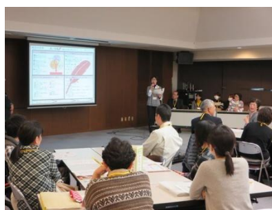
受講者が各自の『成功の宣言』を発表