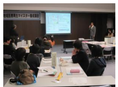
他の受講生の成功の宣言に耳を傾け

最終回の第5回では、受講者全員が第1回以降の講義で学んだ『四画面思考』をもとに、在宅支援に関するネットワークづくりや、老後も安心して住み慣れた家で暮らせる地域づくりなど、各自が描くありたい姿やこれから実践すべき事を発表されました。そして最後に中山医療局管理者より養成講座を3回以上受講した38名へ修了証書が授与されました。