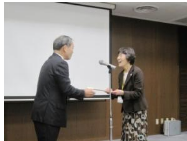
中山医療局管理者から、該当者のみなさんへ修了証書の授与とお祝いのメッセージが贈られました。

この講座を卒業した第3期生は、第1期・第2期生が活動する「南砺の地域医療を守り育てる会」に参加することとなり、講義で培ったネットワークを生かし地域の再生について仲間と考え、継続して自ら行動していける事が期待されます。