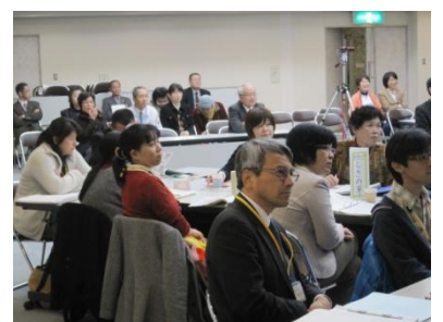
他の受講生の成功の宣言に熱心に耳を傾ける受講生

最終回の第5回では、受講者全員が第1回以降の講義で学んだ『四画面思考』をもとに、それぞれの職場や業務の魅力向上や、老後も安心して暮らせる地域づくりなど、各自が描くありたい姿やこれから実践すべき事を発表されました。そして最後に中山地域包括医療・ケア局管理者より養成講座を3回以上受講し、成功の宣言を発表された41名の修了生へ修了証書が授与されました。