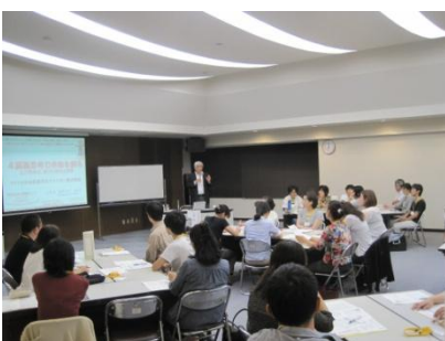
最初は不安と「やらされ感」が大きかった受講生の皆さんも