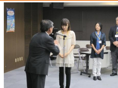
工藤地域包括医療・ケア局管理者から、修了生のみなさんへ修了証書の授与とお祝いのメッセージが贈られました。

この講座を卒業した第5期生は、これまでの修了生が活動する「南砺の地域医療を守り育てる会」に参加することとなり、講義で培ったネットワークを生かし地域の再生について仲間と考え、継続して自ら行動していける事が期待されます。