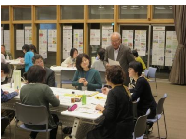
講師の先生からのアドバイスで課題解決に光が見えます

多職種・同地域の方でグループを構成し、地域で直面する問題点や、課題解決の取り組みについて意見が交わされました。今後、自分がなりたい姿や実践したい事を四画面思考法の『成功の宣言』として掲げました。