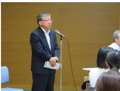
第1回目は副市長も激励に駆けつけられました

多職種・同地域の方でグループを構成し、地域で直面する問題点や、課題解決の取り組みについて意見が交わされました。そして自分のなりたい姿や実践したい事を四画面思考『成功の宣言』として掲げました。