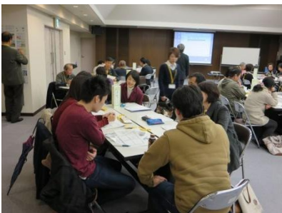
グループワークを通じ、職種を超えて意見交換をされていました