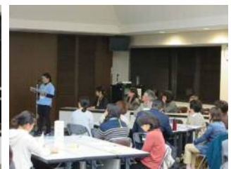
他の受講生の成功の宣言に熱心に耳を傾ける受講生