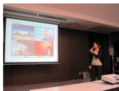
受講者が各自の『成功の宣言』を発表