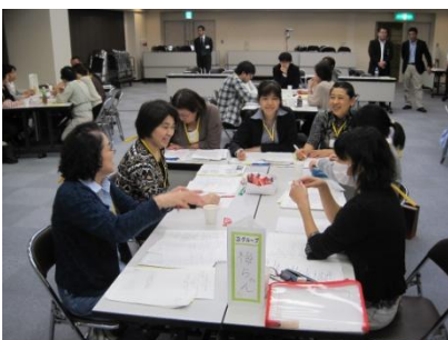
グループワークを通じ、職種を超えて意見交換をされていました