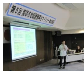
受講者が各自の『成功の宣言』を発表