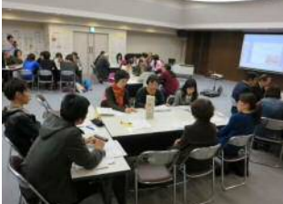
グループワークを通じ、次第に打ち解けあい意見交換をされていました