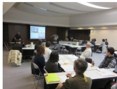
受講者が各自の『成功の宣言』を発表