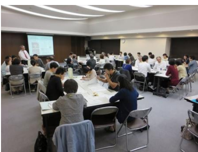
最初は不安と緊張の様子だった受講生の皆さんも