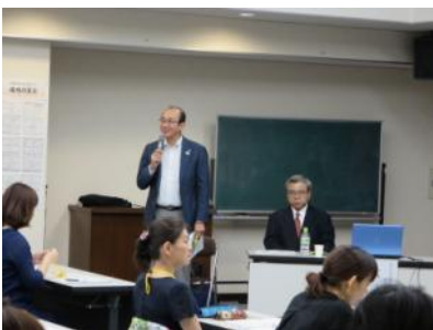
第1回目は市長も激励に駆けつけられました

多職種・同地域の方でグループを構成し、地域で直面する問題点や、課題解決の取り組みについて意見が交わされました。そして自分のなりたい姿や実践したい事を四画面思考『成功の宣言』として掲げました。