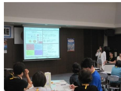
受講者が各自の『成功の宣言』を発表