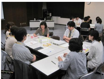
最初は不安と緊張の様子だった受講生の皆さんも