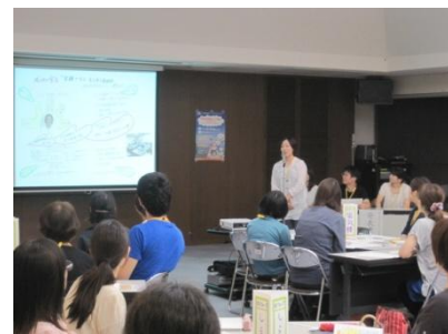
他の受講生の成功の宣言に熱心に耳を傾ける受講生

最終回の第5回では、受講者全員が講義を通して学んだ『四画面思考』をもとに、それぞれの業務での目標や、老後も安心して暮らせる地域づくりなど、各自が描くありたい姿やこれから実践すべき事を発表されました。そして最後に工藤地域包括医療・ケア局管理者より養成講座の課程を修了した44名の修了生へ修了証書が授与されました。