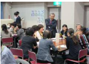
講師の先生からも積極的にアドバイスをいただきました

多職種・同地域の方でグループを構成し、地域で直面する問題点や、課題解決の取り組みについて意見が交わされました。そして自分のなりたい姿や実践したい事を四画面思考『成功の宣言』として掲げました。