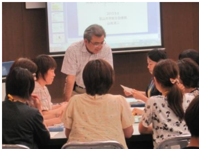
講師の先生からも積極的にアドバイスをいただきました

福祉や医療など多職種の方でグループを構成し、互いの立場で直面する問題点や、課題解決の取り組みについて前向きな意見が交わされました。そして自分のなりたいたい姿や実践したい事を四画面思考『成功の宣言』として掲げました。