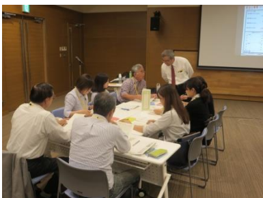
講師の先生からも積極的にアドバイスをいただきました