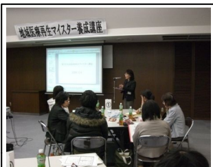
これからの取り組みを発表