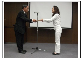
副市長が該当者全員へ修了証書を手渡されました