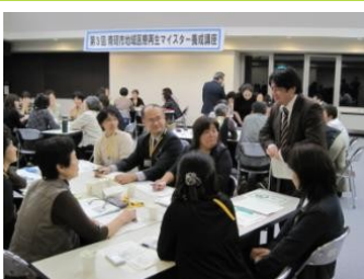
グループワークでは多職種の方が意見を交換

福祉や医療など多職種の方でグループを構成し、互いの立場で直面する問題点や、課題解決の取り組みについて前向きな意見が交わされました。そして自分のなりたいた姿や実践したい事を四面思考『成功の宣言』として掲げました。