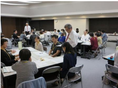
講師の先生からも積極的にアドバイスをいただきました

多職種の方でグループを構成し、直面する問題点や、課題解決の取り組みについて前向きな意見が交わされました。そして自分のなりたいたい姿や実践したい事を四画面思考『成功の宣言』として掲げました。