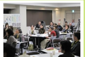
ユーモアあふれる発表が続き、会場は笑顔につつまれました