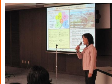
受講者が各自の『成功の宣言』を発表