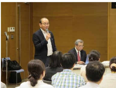
第1回目は市長も激励に駆けつけられました