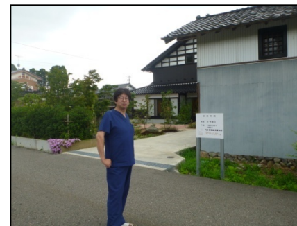
砺波市太田診療所(古民家改装)