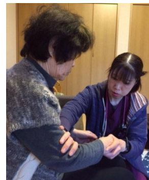
ものがたり診療所で 1名研修中