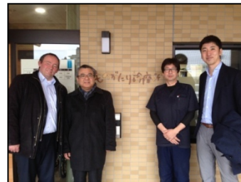
ものがたり診療所