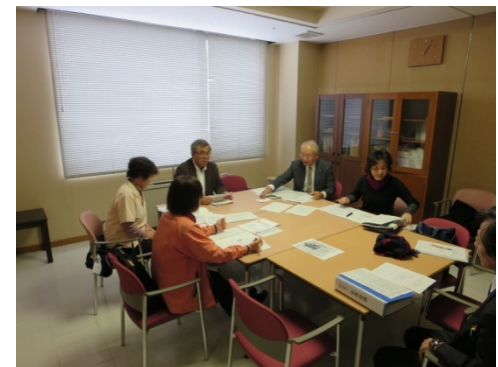
南砺市チーム会議