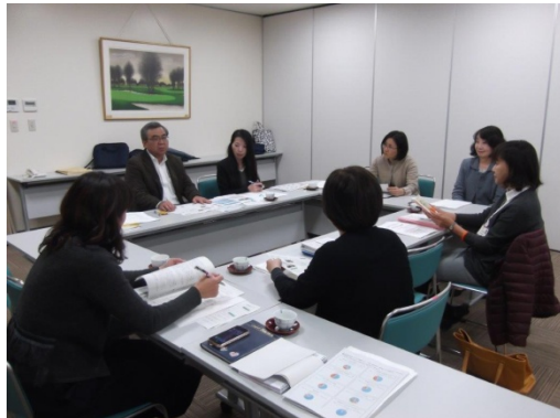
富山市チーム会議