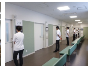
2016年 シミュレーター使用せず 臨床推論OSCE