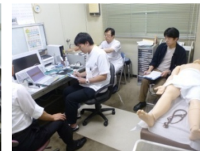
2014年.2015年 シミュレーター使用